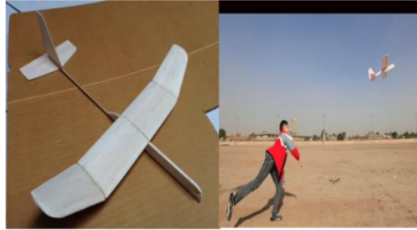
Gambar 3: Alat peraga aeromodelling

menafsirkan, hipotesis, klasifikasi, berkomunikasi dan menerapkan konsep. Alat peraga yang digunakan dalam proses pembelajaran berupa aeromodelling dapat dilihat pada Gambar 3.