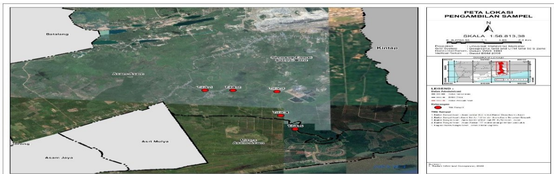
Gambar 1. Area penelitian di tepi Sungai Asam-Asam

titik observasi. Tahap pelaksanaan yaitu melakukan observasi pada lima titik sampling. Observasi pada lima titik sampling dilakukan masing-masing selama tiga hari dan kelima titik sampling tersebut dipilih secara sengaja (terdapat pohon mangrove jenis Sonneratia caseolaris ) dengan tujuan tertentu (bekantan yang ditemukan yang terbanyak).