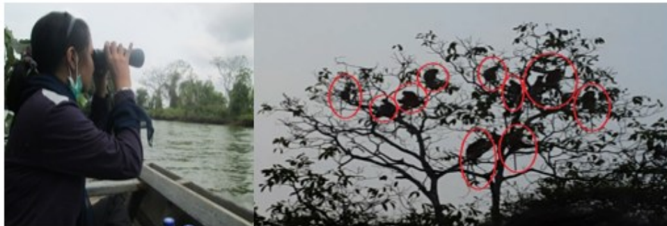
Gambar 2. Pengamatan Nasalis larvatus di area penelitian

individu yang mewakili satu kelompok. Jika jumlah individu paling sedikit ditemukan, diasumsikan bahwa individu lain tidak terlihat saat pengamatan. Kemudian, dilanjutkan dengan mengukur parameter lingkungan.