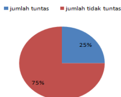
Gambar 2. Grafik Ketuntasan Belajar Peserta Didik Pada Aspek Psikomotor Siklus I

Penerapan model pembelajaran Discovery Learning pada siklus I diperoleh ketuntasan belajar siswa sesuai Gambar 2.